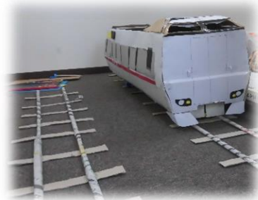
自由時間に作った大作！ “特急 こうのとり”