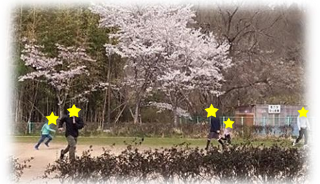
サクラの下でおにごっこ!

LINE等のSNSを利用し、情報を交換する子どももいると思います。教室でも今後、トレーニングの中に、マナーやルールなどを取り入れていきたいと思っていますが、各ご家庭でSNS利用の危険性について、よくお話しただけたらと思います。様々な事件も起きていますので、子どもたちが安全に、安心してスマホや携帯が使えるよう、ご家庭と一緒に取り組んでいきたいと思えますのでどうぞご理解とご協力をお願いします。